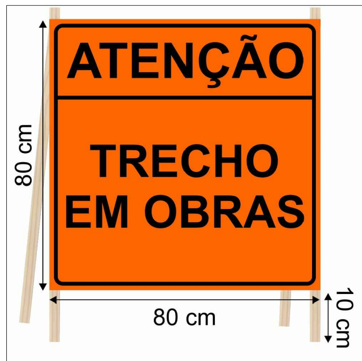
DETALHE DA PLACA PROVISÓRIA

Nota 01: A sinalização definitiva será implantada à uma distância de 20,00 metros a partir da borda da ponte e 4,00 metros do eixo da estrada.